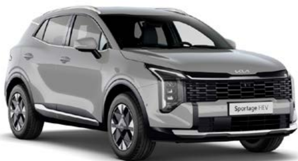
Gris Céramique (WAF)