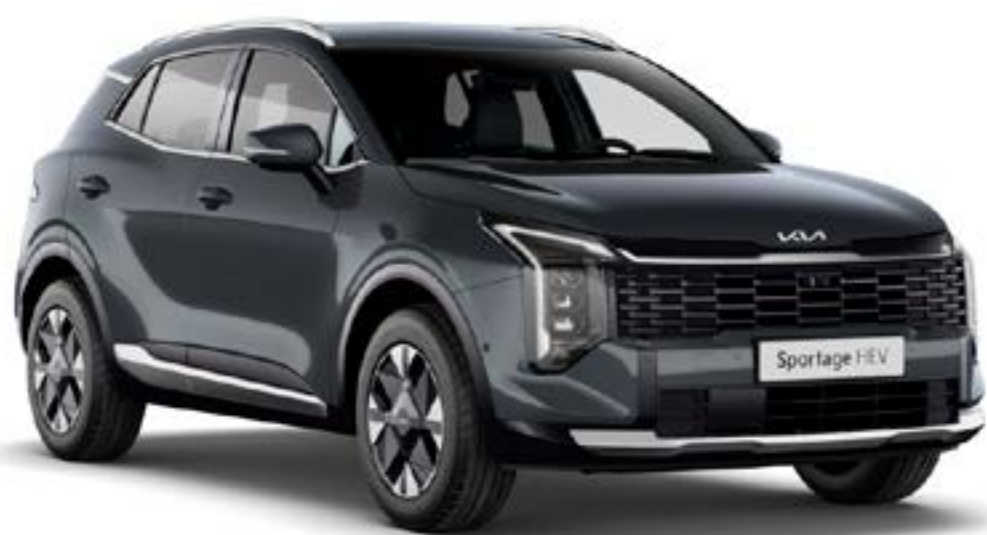
Gris Eclipse (H8G)