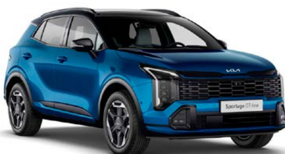
Bleu Fusion / Noir brillant (HA8)