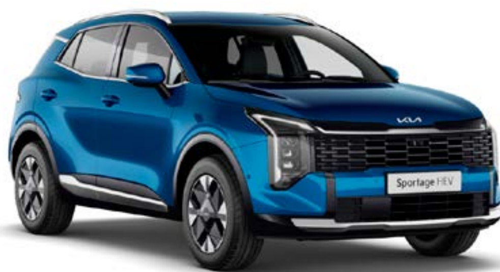
Bleu Fusion (B3L)