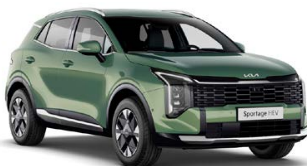
Vert Bornéo (EXG)