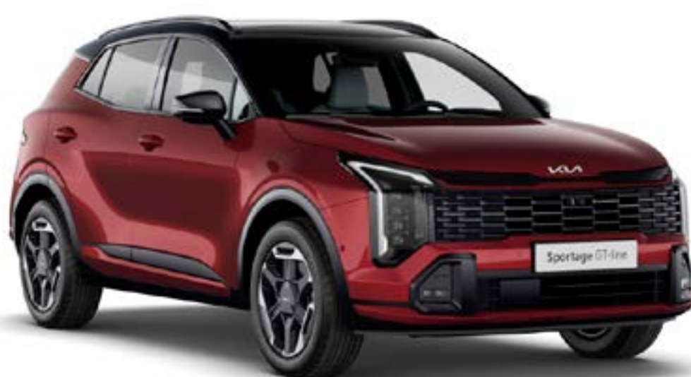
Rouge Grenat / Noir brillant (HBR)