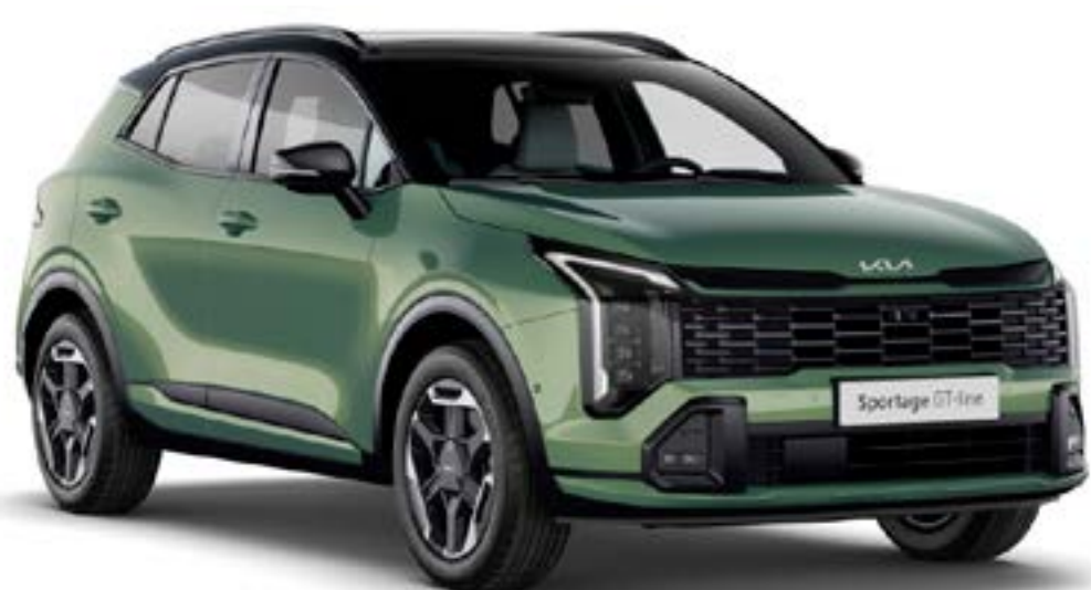
Vert Bornéo / Noir brillant (HBC)