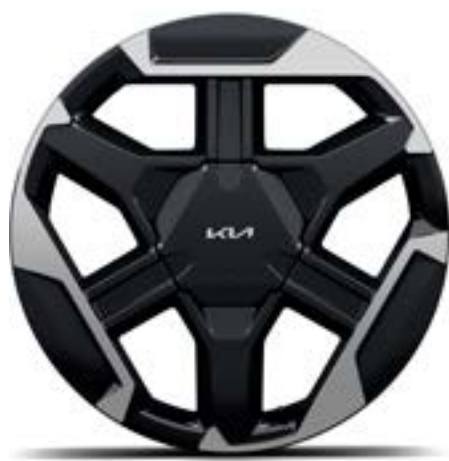
Jantes alliage 18" GT-Line