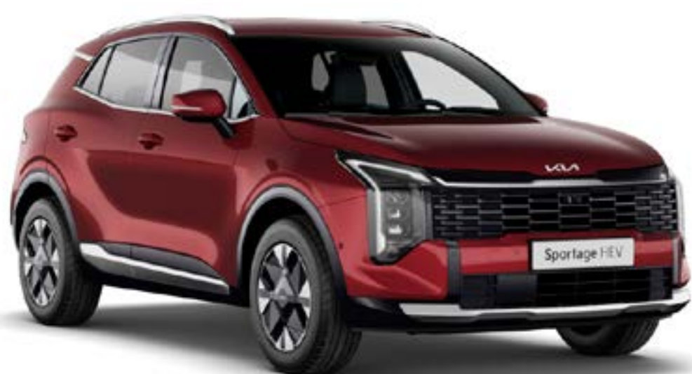
Rouge Grenat (ARD)