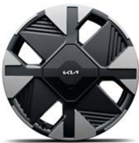
Jantes alliage 17" aérodynamiques