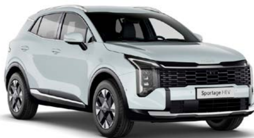
Blanc Céleste (WD)