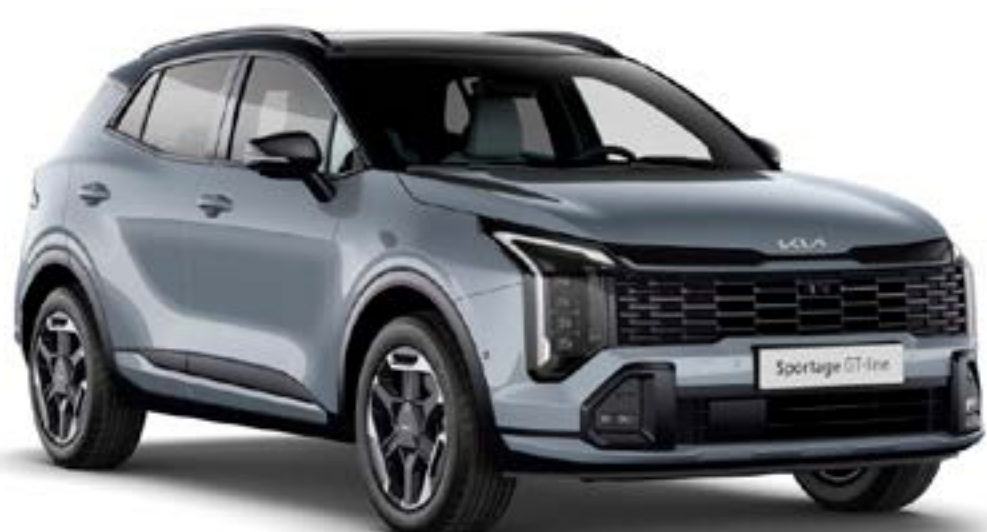
Gris Perle / Noir brillant (HA5)