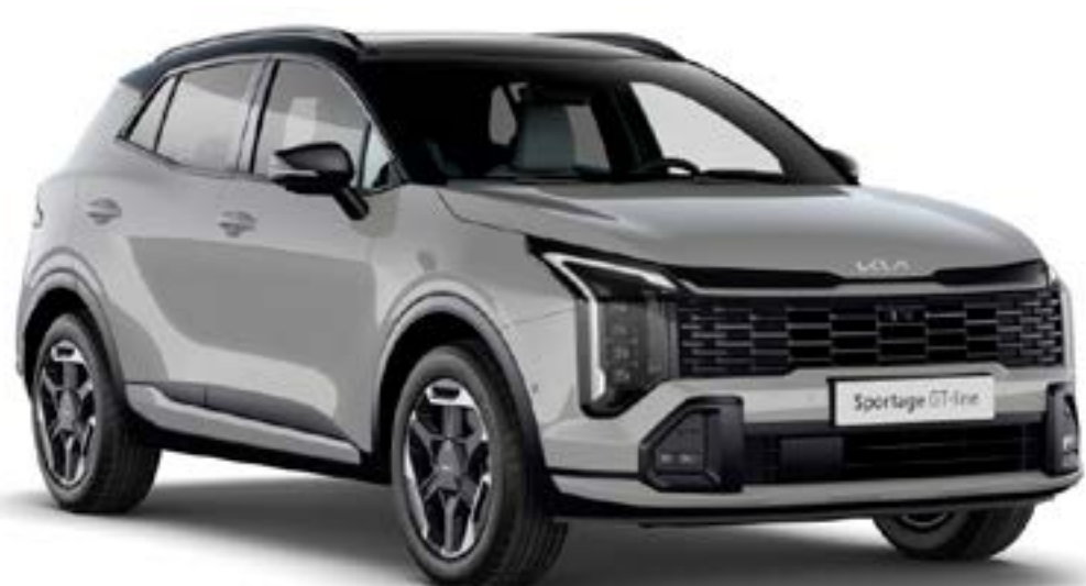
Gris Céramique / Noir Brillant (HBM)