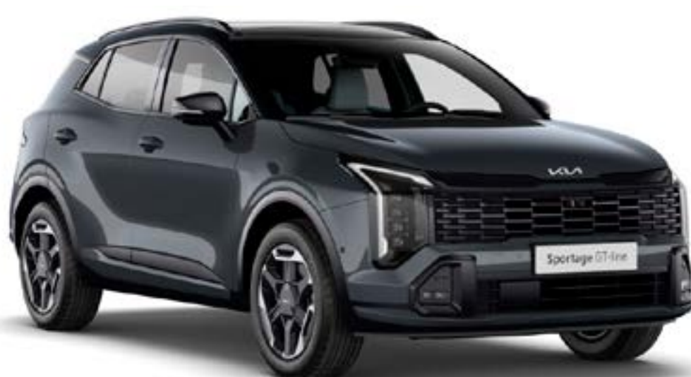
Gris Eclipse / Noir brillant (HA6)