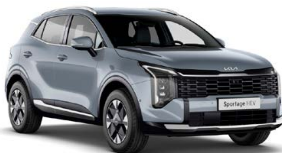
Gris Perle (CSS)