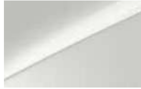
Blanc Sensation (HW2) (2)