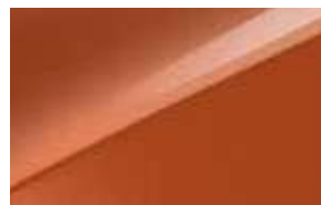
Orange Cuivre (RNG) (3)(5)