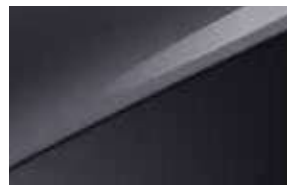
Gris Eclipse (H8G)