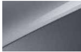
Gris Perle (CSS)