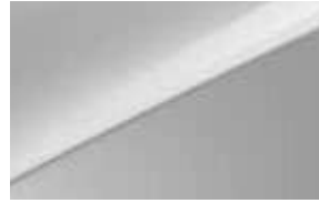
Gris Acier (KCS) (4)(5)