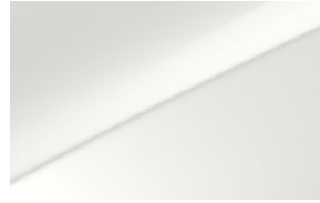
Blanc (WD) (1)

Placez votre monde sous le signe de la créativité. Ajoutez une touche de personnalité à votre horizon. Laissez Kia vous inspirer. Vous avez le choix entre 13 coloris extérieurs et 6 magnifiques modèles de jante pour donner libre cours à vos envies.