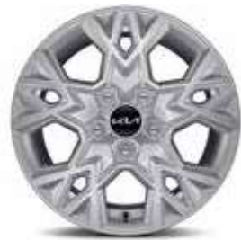
Jantes en alliage 16" (Active)