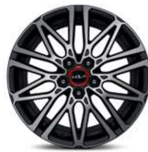
Jantes en alliage 18" (GT)