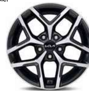
Jantes en alliage 17" (Premium)