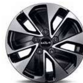
Jantes en alliage 16" (Motion et Active)