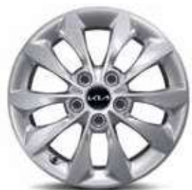
Jantes en acier 16" avec enjoliveurs (Motion)