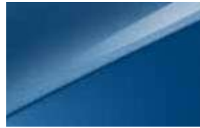
Bleu Fusion (B3L)