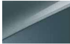
Gris Sirius (USG) (4)