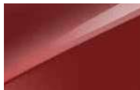
Rouge Rubis (AA9)