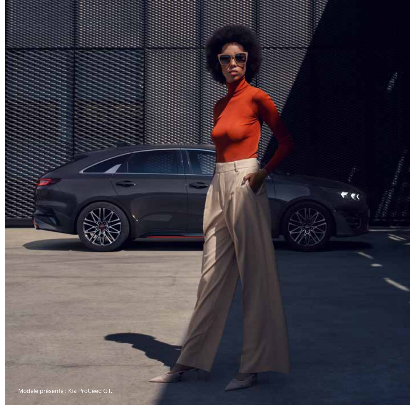
Modèle présenté : Kia ProCeed GT.