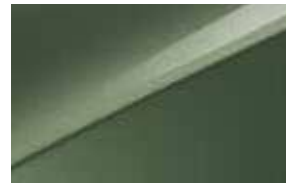
Vert Bornéo (EXG)