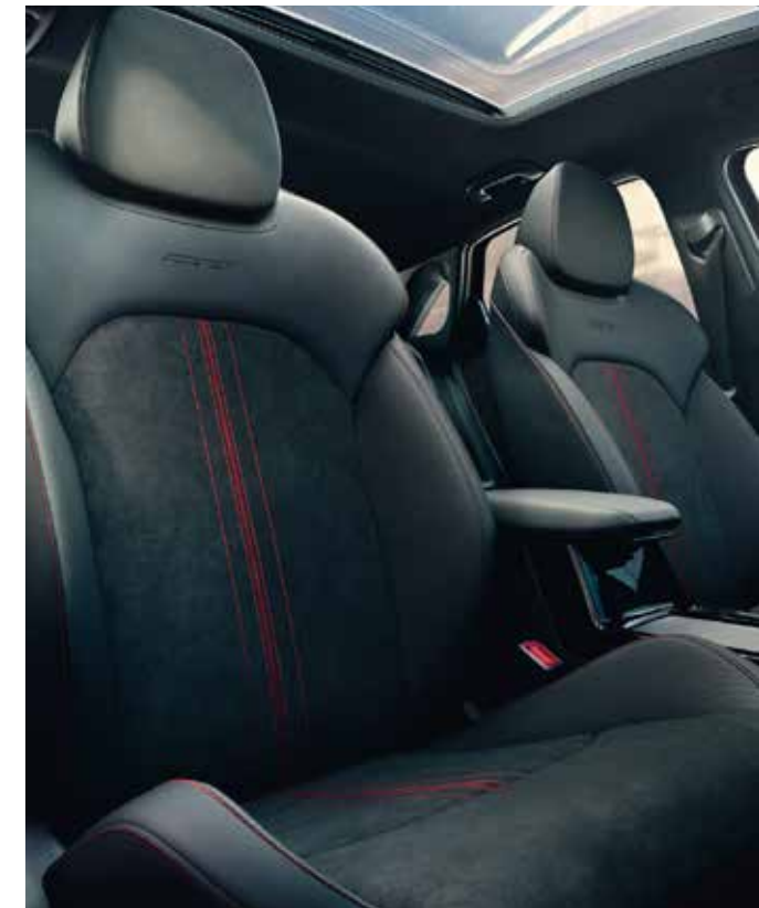
Modèle présenté : Kia ProCeed GT.