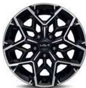
Jantes en alliage 17" (GT-line et GT-line Premium)